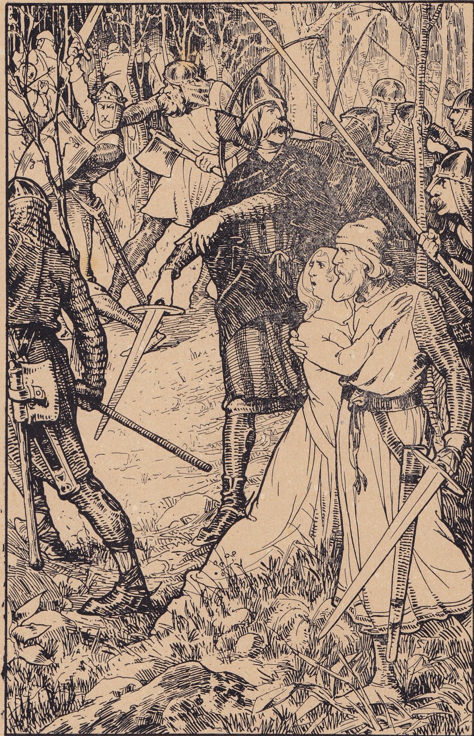
Wordt hij langs achteren door een sterke vuist aangegrepen. (blz. 236).